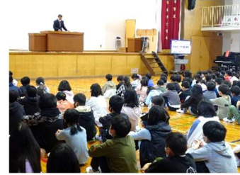
始業式 合言葉は「やってみよう！」

ドキドキワクワクで迎えた始業式。 四月八日、学校に元気な子どもたちが帰ってきました。校舎や運動場に響く元気な子どもたちの元気な声がエネルギーとなり、学校が動き出ししました。