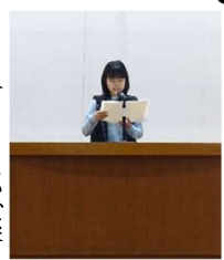
始業式の児童代表最上級生堂々と発表しました。

より良くしたい、楽しくしたいと、まずは「やってみよう」と「挑戦」を大切にしてみようこと（挑戦）を大切にしてみようこと（挑戦）を考えました。うまくいかないこともあるでしょう。でも、その失敗も自分を成長させる大切なエネルギーになります。「できる できる できる」と自分を励まして、自分を信じて進んでいきましょう。もちろん、職員は子どもたちの味方です。力を伸ばすよう支えていきます。