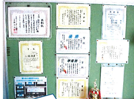
お子様が各種大会等で賞状をもらった際は、掲示しますので学校までお知らせください。

2024年は、メジャーリーグの大谷翔平選手が54本塁打59盗塁を達成し、50-50の大記録を打ち立てました。