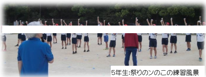
5年生:祭りののこの練習風景