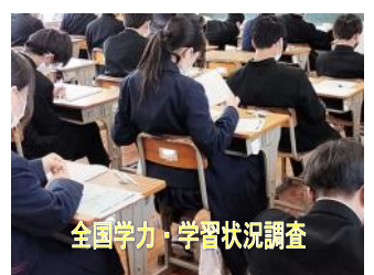
全国学力・学習状況調査