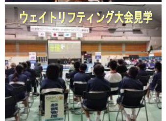
ウェイトリフティング大会見学