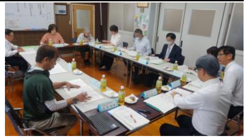
【令和6年度学校運営協議会委員(敬称略)】